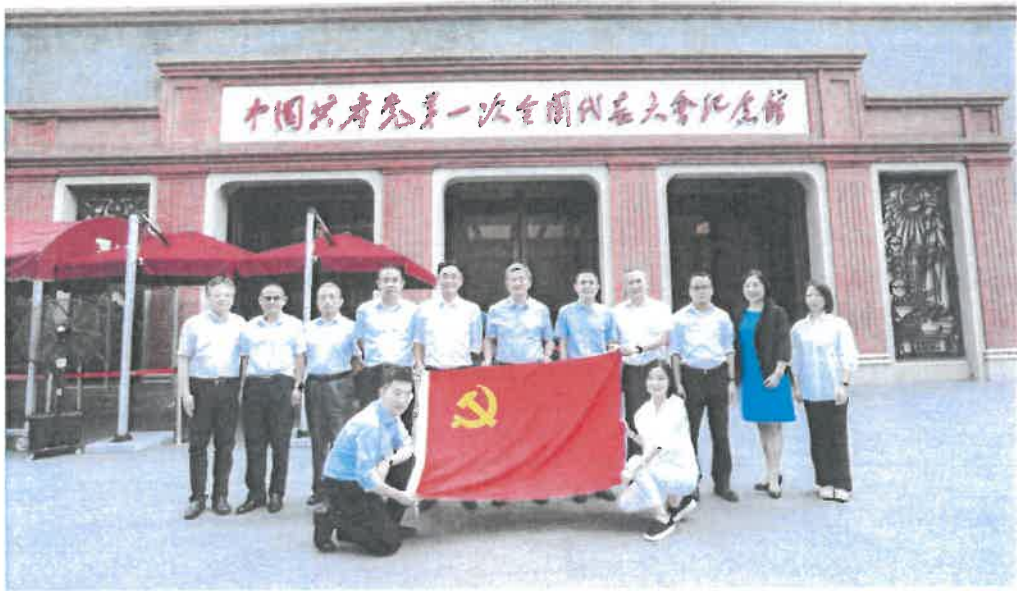
党业融合暨业务赋能主题活动

（三）2022年9月23日，公司举办了合规管理人员线上合规知识劳动竞赛。作为合规文化建设年的三季度合规“培训季”中的一个重要活动，此次竞赛以外部监管政策法规、内部制度规范为主要内容，致力于考察华金证券合规专员的知识储备和合规管理能力。竞赛以答题准确率和速度决胜负，按照每支队伍所有成员的平均分进行排名。来自57个部门、分支机构及子公司的67名参赛选手争相竞逐，充分展现了华金证券合规管理人员的综合素养、合规专业能力。经过激烈角逐，最终来自辽宁分公司、常州营业部、广州营业部、南京营业部、重庆分公司、山东分公司的合规专员组成的满天星队摘得桂冠。