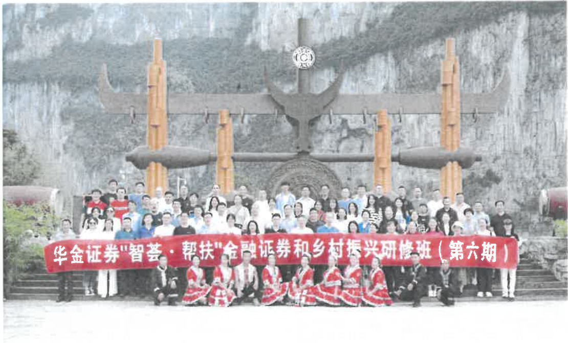
“智荟·帮扶”金融证券和乡村振兴研修班（第六期）

十是建设公司品牌，树立良好形象。公司不断提升业务和管理能力，通过优质服务，获得市场赞誉。公司产品“华金证券横琴人寿基础设施策略 2 号 FOF 单一资产管理计划”获得“第十三届基金与财富管理·介甫奖——优秀 REITs 投资 FOF 产品”奖，“华金证券股份有限公司鸿盈 3 号集合资产管理计划”获得“第十三届基金与财富管理·介甫奖——优秀固收+策略产品”奖，华金-华发租赁住房二号第一期资产支持专项计划被视财中国评选为第八届资产证券化·介甫奖——“优秀类 REITs 产品”，投行条线承做的“华金证券-惠莞高速资产支持专项计划”荣获第八届资产证券化·介甫奖——优质收费收益权 ABS 奖”、“优质民企 ABS