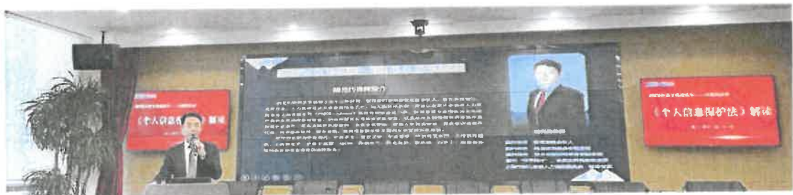
“合规文化建设年”培训照片

各分支机构及子公司结合实际情况，将外规的合规要求转化为内部规章制度，并指导在展业过程中“学好、用好、落实好”公司各项制度。2022年，公司开展了“合规文化建设年”活动，活动围绕“规范发展，行稳致远”主题，分别开展了“合规文创季”、“合规交流季”、“合规培训季”、“合规普法季”等四个季度的专题活动，将合规文化建设与员工业余文化生活相结合，将合规理念培养与日常工作交流相结合，将合规培训与自我价值提升相结合，将合规经营理念树立与普法教育相结合，向员工普及合规和法律知识，自上而下全面提升员工合规和法律意识，扎实推进合规工作，为公司稳健、规范发展保驾护航。