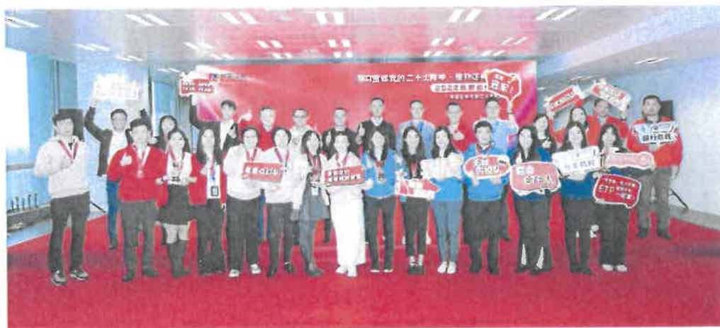
学习贯彻党的二十大精神·提升证券业务技能-2022年劳动竞赛

(七) 2022年11月28日,公司组织开展华金证券合规文化年系列活动“学习贯彻党的二十大精神提升证券行业技能——2022年劳动竞赛决赛”。竞赛推动员工进一步提高政治理论素养、丰富金融业务知识储备、树牢合规执业意识。与此同时,引导员工自觉遵守规章制度,全面推进合规文化建设,在新时代的征程上奋勇前进!