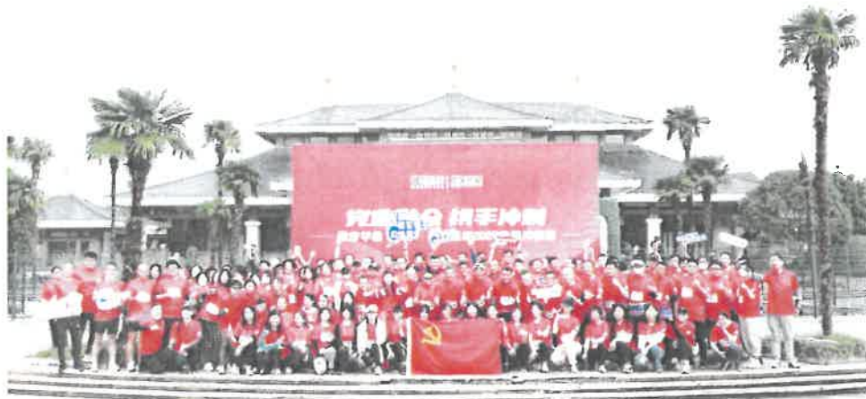
党建专项活动暨劲步华金第3期

(七) 2022年11月28日,公司组织开展华金证券合规文化年系列活动“学习贯彻党的二十大精神提升证券行业技能——2022年劳动竞赛决赛”。竞赛推动员工进一步提高政治理论素养、丰富金融业务知识储备、树牢合规执业意识。与此同时,引导员工自觉遵守规章制度,全面推进合规文化建设,在新时代的征程上奋勇前进!