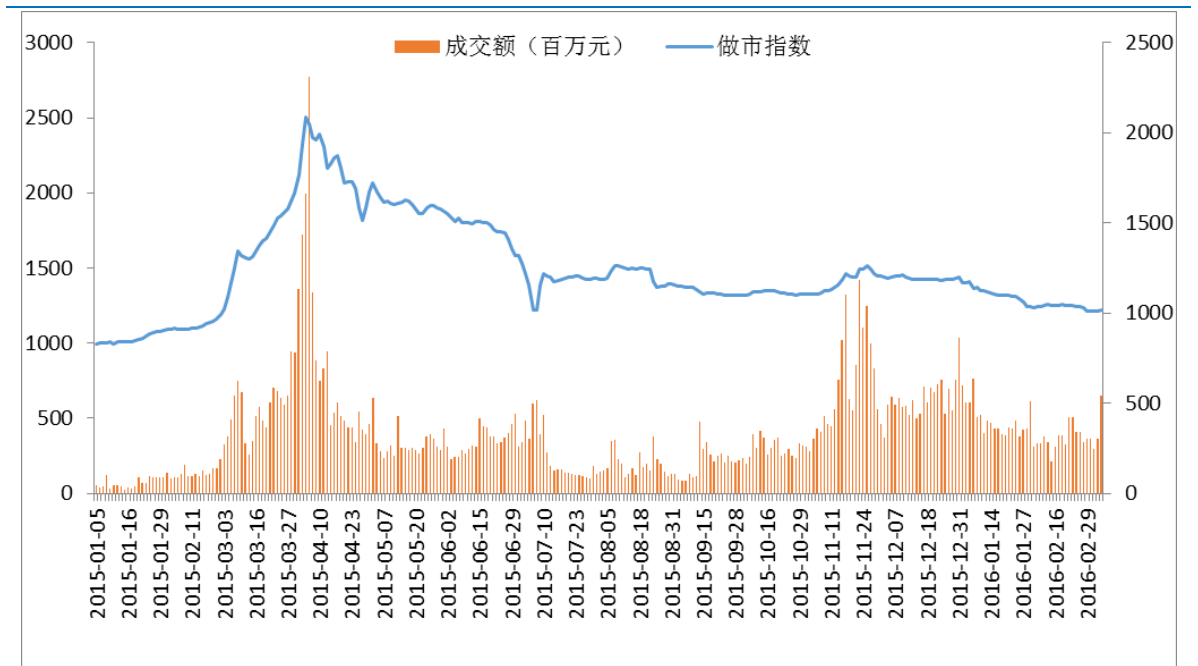
图 1：做市成交金额与指数走势